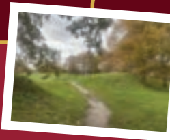
U volgt het pad verder via het Th. Kamer (Ravel 44) pad en wandelt bovenaan Bastion Oranje.